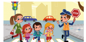
Verkeer lees je op p.7