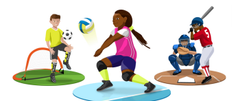
Sport lees je op p. 8