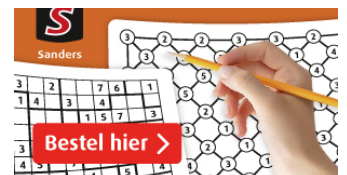
Ontspanning en plezier vind je op p. 9 tot 11