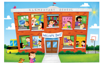
Schoolnieuws lees je op p. 4 tot 6