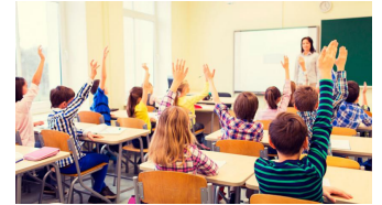
Klasnieuws lees je op p. 2 en 3

je veel leesplezier aan deze krant! Heb jij een idee voor een leuk artikel of heb je iets leuks meegemaakt op school? Meld het dan zeker aan één van de leerlingen van het vierde of het zesde leerjaar en wie weet staat jouw nieuwsitem in de volgende editie van de schoolkrant