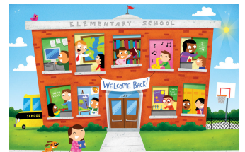
Schoolnieuws lees je op p. 3