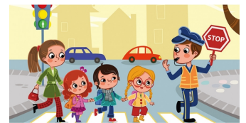
Verkeer lees je op p.4